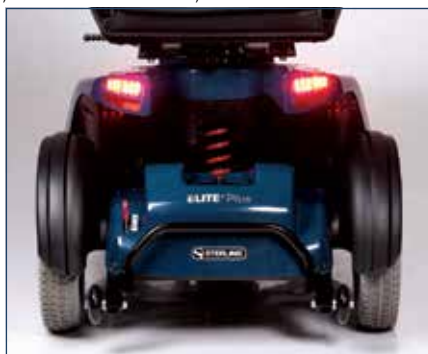
Sospensioni posteriori idrauliche regolabili, meccanismo di sblocco del motore e routine antiribaltamento