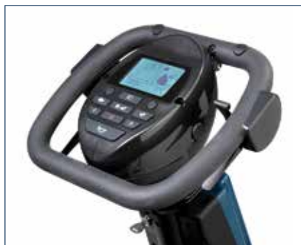
Comandi ergonomici con display LCD e pulsanti soft-touch