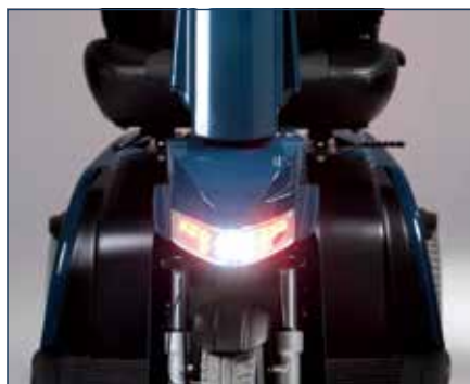
Luci a LED marchiate CE: fanale e luci posteriori, frecce e luci dei freni

Sono disponibili accessori che completano lo scooter con tutti i comfort, per rispondere ai vostri bisogni e ai vostri desideri personali.