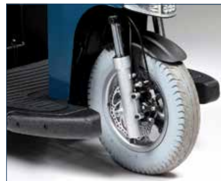
Gli ammortizzatori anteriori e i freni a disco offrono un eccellente comfort di guida