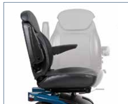
Confortevole sedile regolabile (360° di rotazione) con supporti lombari laterali