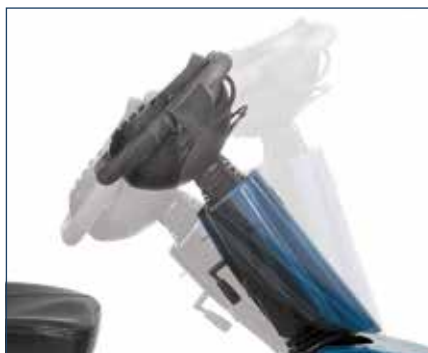
Manubrio regolabile in modo semplice per una postura corretta